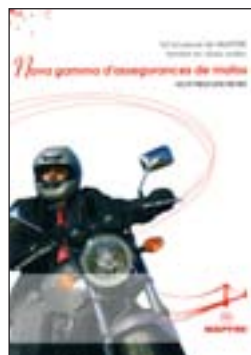
8. Motos Quantitat: _____