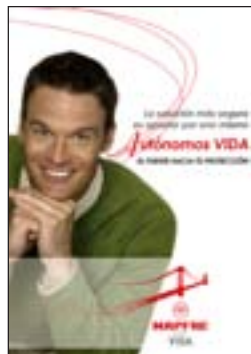
1. Autónomos Quantitat: _____

NOTES: Els calendaris s'enviaran per agència de transports directament a cada oficina MAPFRE. Els ports s'afegiran a la factura i pugen 5,30 € + IVA. El cobrament es farà a 30 dies data factura, carregant-lo en el compte bancari especificat.