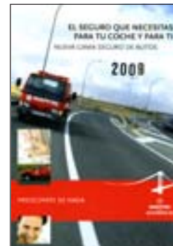
5. Automóviles Quantitat: _____