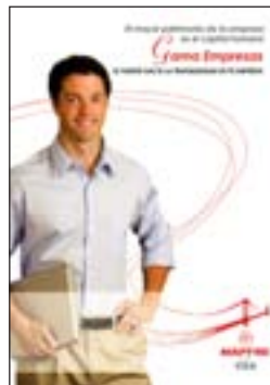
3. Empresas Quantitat: _____