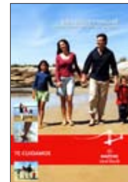
6. Salud familiar Quantitat: _____