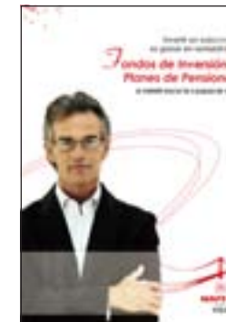
7. Fondos y Planes Quantitat: _____