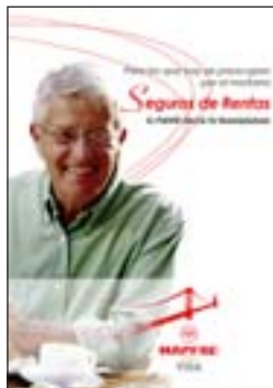
2. Seguros de rentas Quantitat: _____